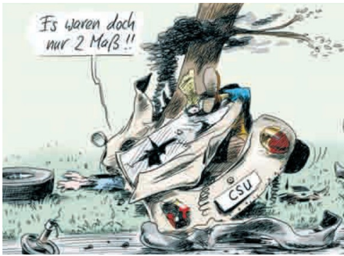
(Karikatur von Stuttgartmann aus dem „Freitag“ vom 3.10.08, S. 2)