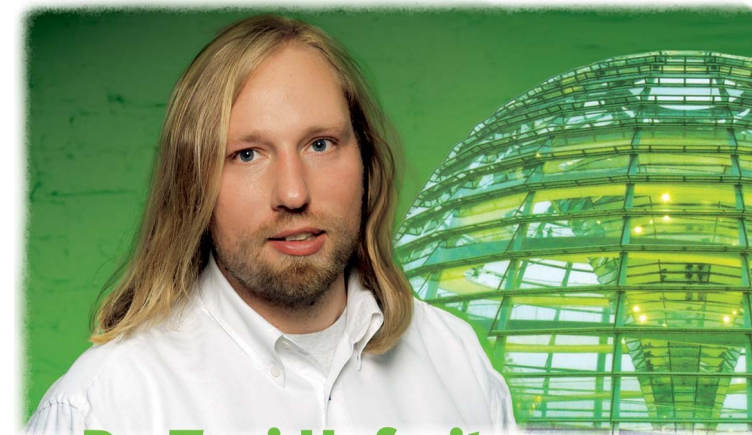
Dr. Toni Hofreiter

Mitglied des Deutschen Bundestags www.toni-hofreiter.de