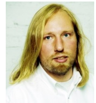
Dr. Toni Hofreiter

Mitglied des Deutschen Bundestags www.toni-hofreiter.de