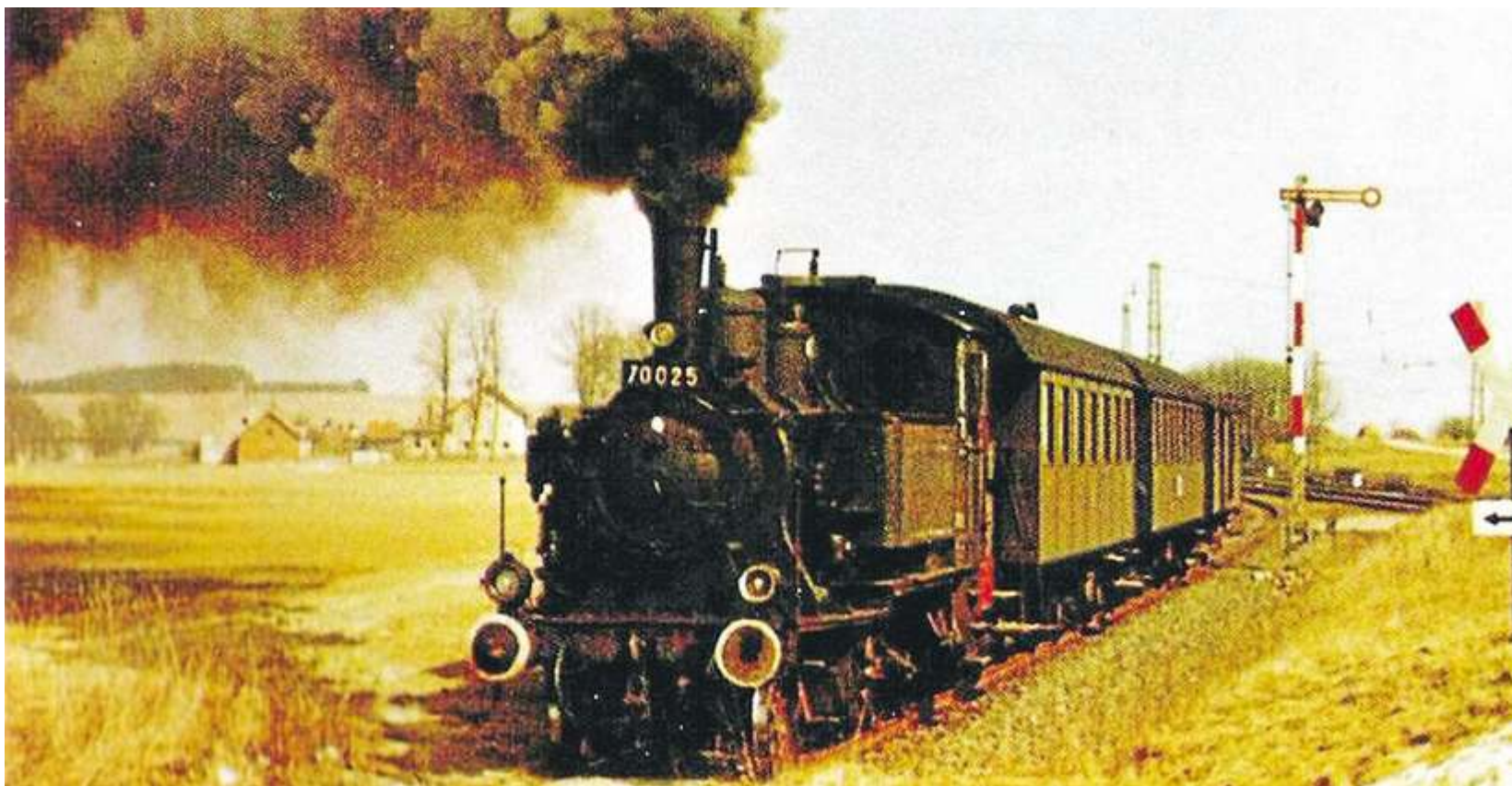
Historische Bilder wurden für Eisenbahnfans als Anschauungsmaterial in den Film aufgenommen.